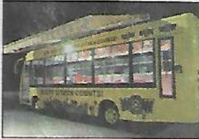
The coach of WoW bus.

The coach is a luxury bus, equipped with toys, slates, colours, whiteboard, a projector and a screen, five laptops, a desk, computer, materials for art & crafts, a wash-basin, first-aid